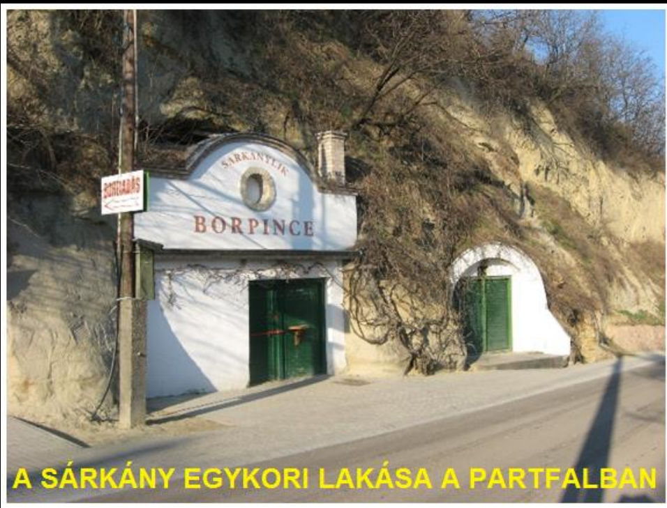
A SÁRKÁNY EGYKORI LAKÁSA A PARTFALBAN