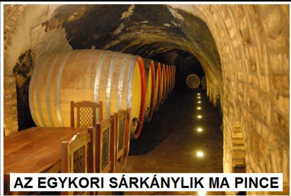
AZ EGYKORI SÁRKÁNYLIK MA PINCE