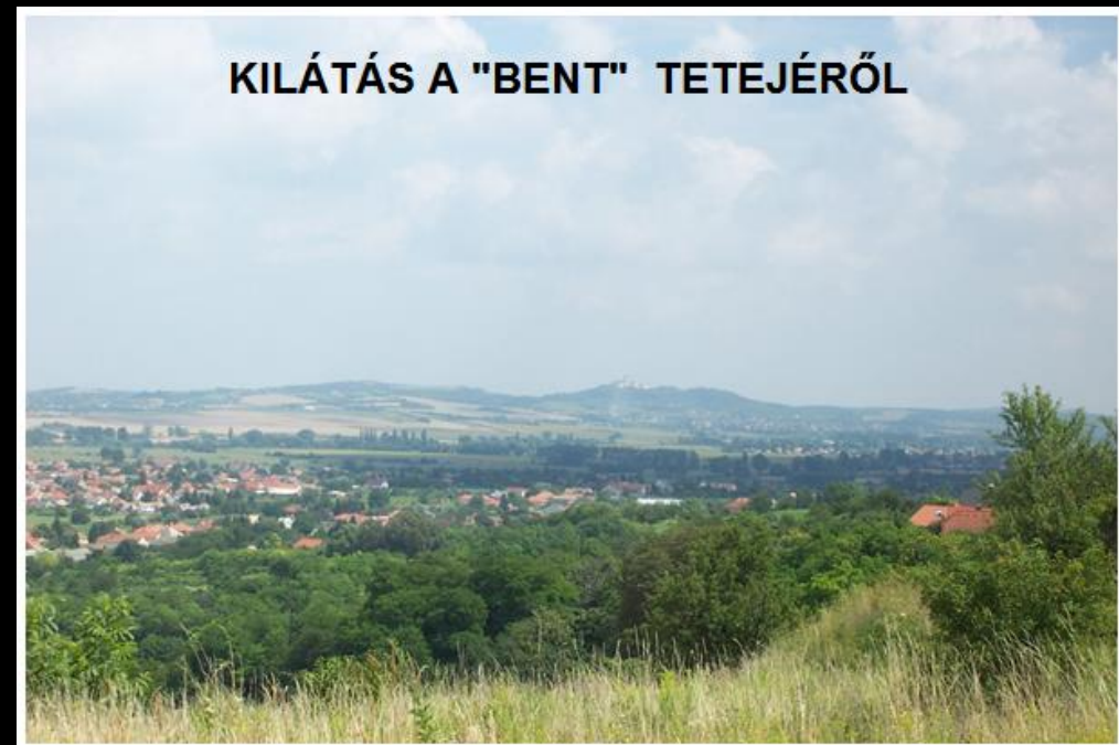
KILÁTÁS A "BENT" TETEJÉRŐL